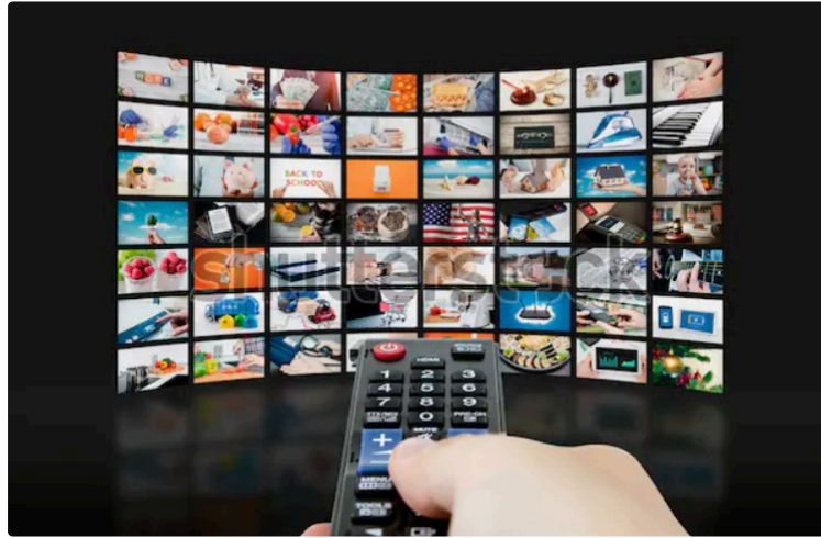
A la télévision jeudi soir...

Réveillon de Noël oblige, la télévision fait la part belle aux émissions de divertissement.