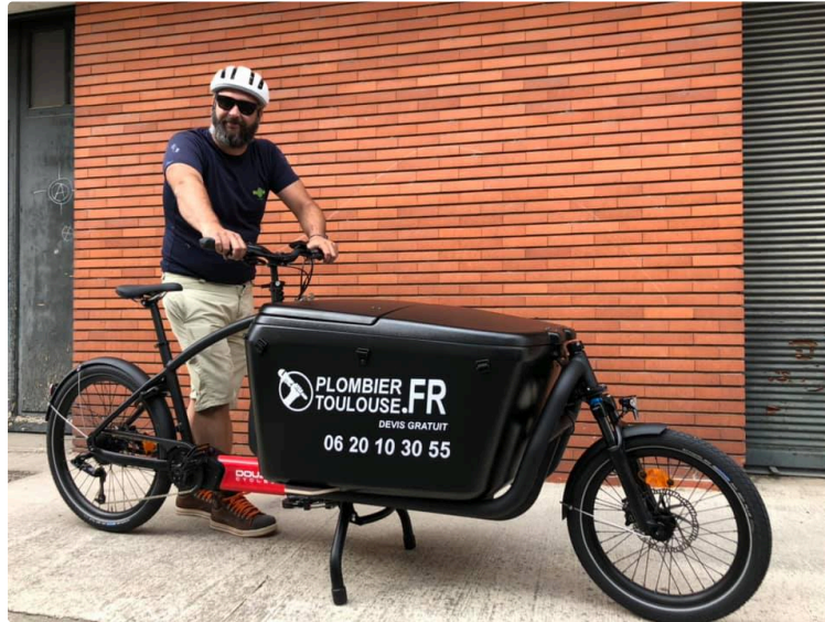
JHOG et les vélos cargos électriques professionnels

La mobilité douce adaptée aux entreprises et artisans