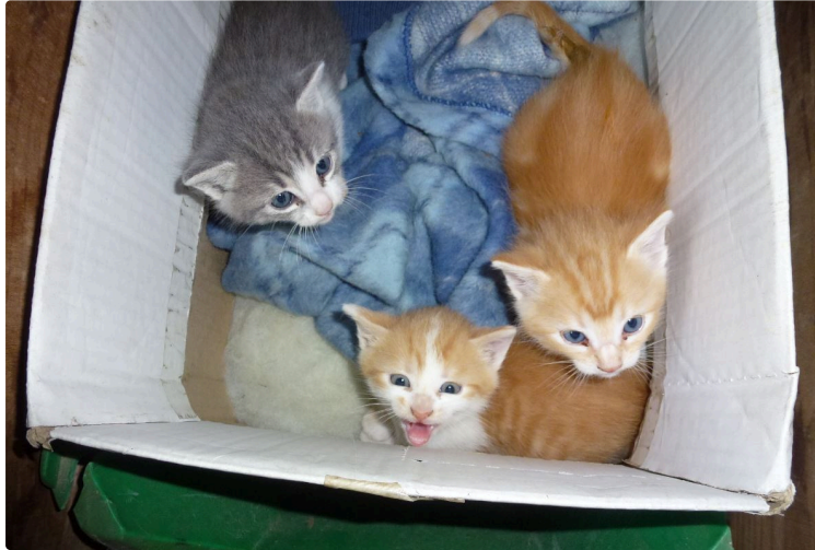
2021 : l'année du S

Souvent, le plus compliqué n'étant pas d'adopter un animal, mais plutôt de lui trouver un nom qui conviendra