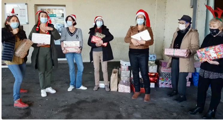
Succès des Boîtes de Noël

Les gersois encore une fois très généreux