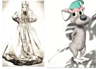
La fée, le lutin, la souris (suite et fin )