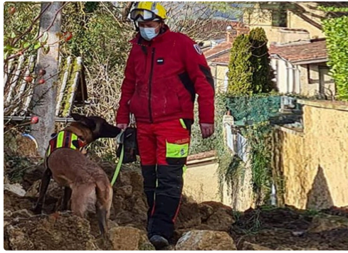
effondrement montesquiou chien.JPG