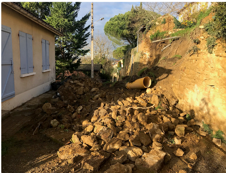
Violent incendie au Garros à Auch. Montesquiou, effondrement d'un mur de soutènement.