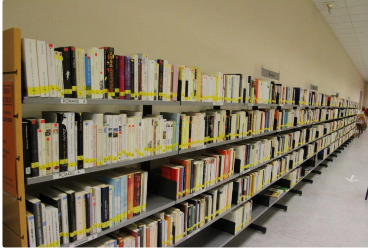
La Médiathèque a su se distinguer

De telle manière qu'en cette fin d'année, le 12 décembre dernier, elle a eu les honneurs de France 3. Le système de portage à domicile, mis en place lors des deux confinements, a éveillé l'intérêt de la télévision régionale.