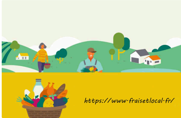
Des produits fermiers en vente directe

Frais et local, une nouvelle plateforme nationale à l'initiative du ministère de l'Agriculture et des chambres d'agriculture