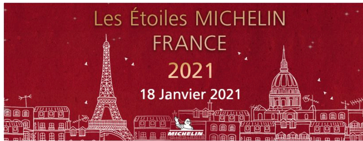
Le Michelin 2021 dévoilé

Quatre établissements gersois distingués