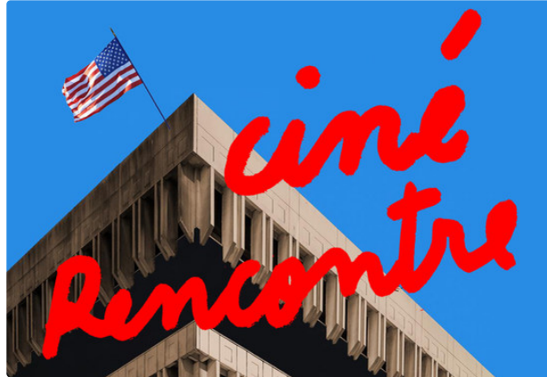
Branchez-vous sur la 25e heure !

Avec City Hall, un film documentaire pour célébrer l'investiture de Joe Biden