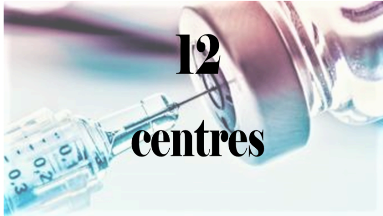
12 centres de vaccination

Auch, Mirande, Condom, Fleurance, Samatan, Nogaro, Riscle, L'Isle-Jourdain, Eauze, Vic-Fezensac, Masseube, Lectoure