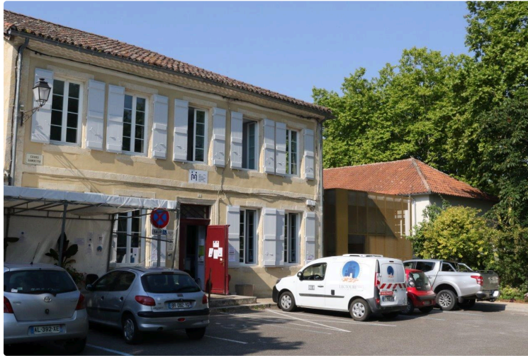
Les projets de CPTS en Occitanie

Les Communautés Professionnelles Territoriales de Santé (CPTS) s'engagent pour la santé de tous dans les territoires. Elles participent à la lutte contre le COVID19 et aux campagnes de prévention et de vaccination de la population.