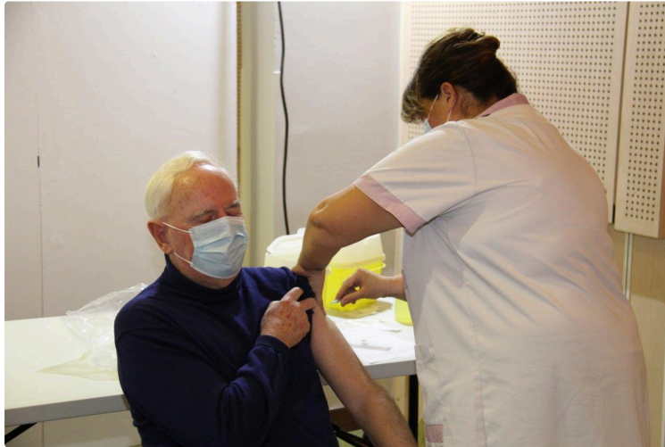
Après vous, messieurs les Anglais !

... Encore un article sur le sujet du moment ! Impossible d'y échapper en ces temps de début de vaccination Covid-19 !