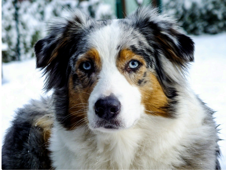
Une année record pour les chiens !

Pour découvrir les chiens préférés des Français, il suffit de se rapporter au nombre d'inscriptions au LOF.