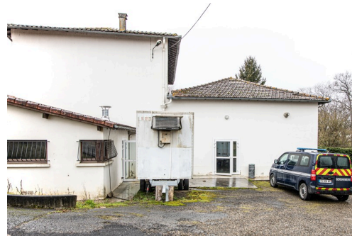
Vue du foyer de Perchède - les gendarmes sont à l'intérieur

N.B.- La photo du haut de page montre l'équipe de bénévoles qui a découvert le vol à l'étang du Pesquè.