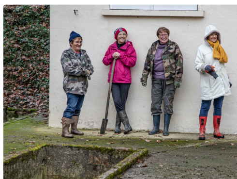
Accueil par l'équipe de bénévoles