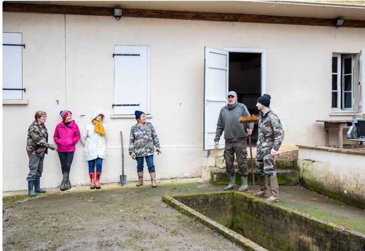
Cambriolage pour du pâté et des saucisses à Perchède