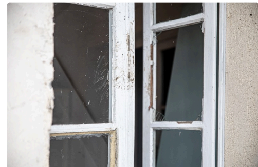
Carreau cassé à droite sur cette fenêtre