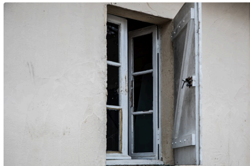
Fenêtre fracturée au local des chasseurs