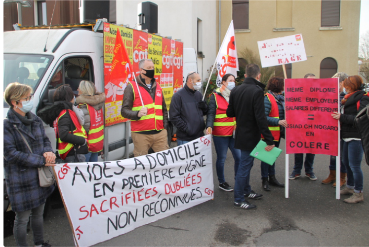
Des primes Segur plus étendues

Trop de personnes en sont encore exclues.