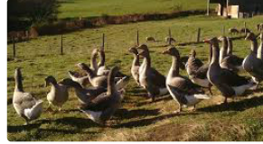
Influenza aviaire : le mal s'étend

À la date du 25 janvier, selon le ministère de l'agriculture, la France compte 409 foyers d'influenza aviaire hautement pathogène confirmés par le laboratoire national de référence (LNR) de l'ANSES.