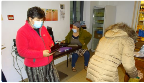
Ce n'est pas la pesée des âmes, juste celle des légumes.