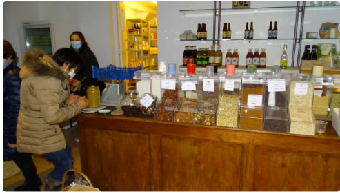
Il y a tout ce qu'il faut et on peut proposer autre chose. Un groupe produit existe.