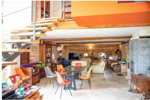
Les deux niveaux