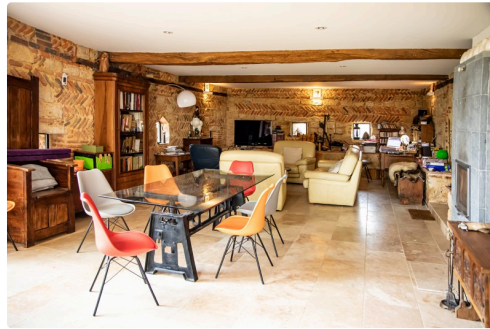
Pièce de séjour ex-salle des meules