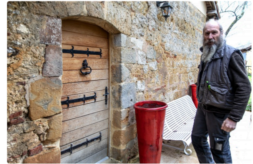
Une porte faite par Gérald Deturck