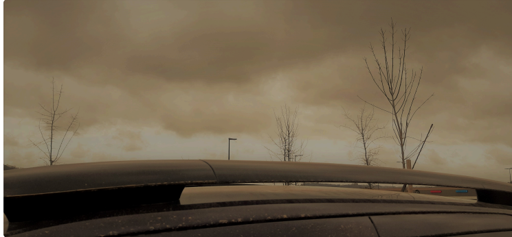
Une pluie de sable samedi matin !

Ce matin, les Vicois ont eu la surprise de découvrir à leur réveil un ciel bas encombré de nuages de couleur ocre.