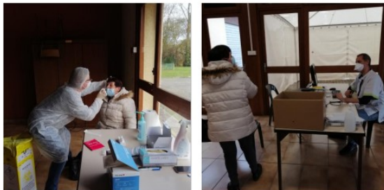
Les tests antigéniques en accès libre se poursuivent

Depuis début décembre, des tests antigéniques sont proposés trois fois par semaine salle polyvalente par un groupe de professionnels composé de pharmaciens et infirmiers libéraux.