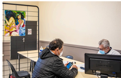
Consultation médicale avant la vaccination

(1) Renseignements au 06 81 10 06 87. (2) Renseignements au 07 88 85 61 54.