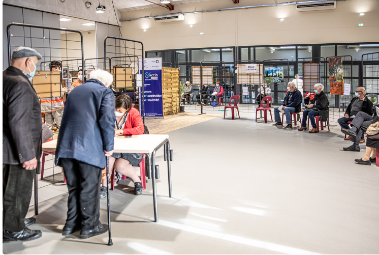
Vaccin et expo simultanés à Nogaro

Un peintre et un photographe exposent pendant la vaccination