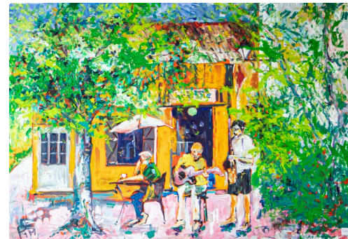
Tableau de Pim Harren