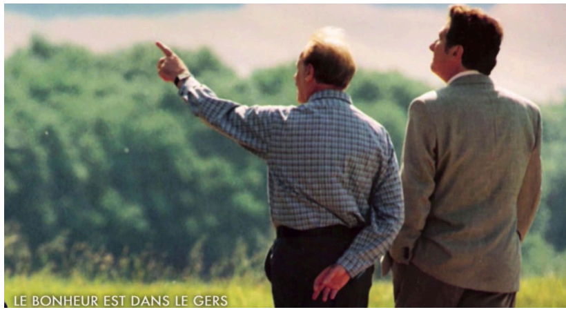
LE BONHEUR EST DANS LE GERS