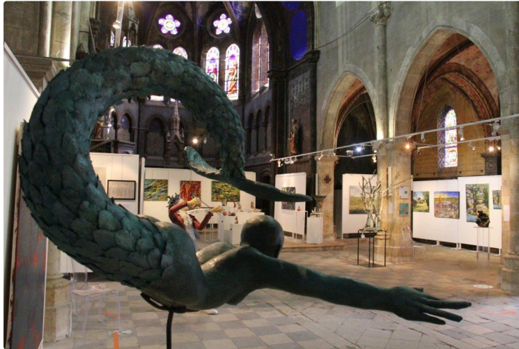
En avant-première, le programme 2021 des expositions

Élaboré par les Amis de l'Espace Saint-Michel