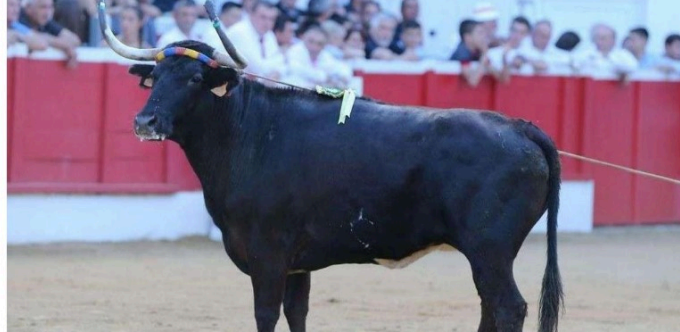
Ganaderia Deyris : « la reine Ibiza s'en est allée »

C'est avec une grande émotion que la ganaderia Deyris a annoncé samedi dernier le décès de la fameuse Ibiza. Elle a succombé à l'âge de 12 ans à une crise de foie.