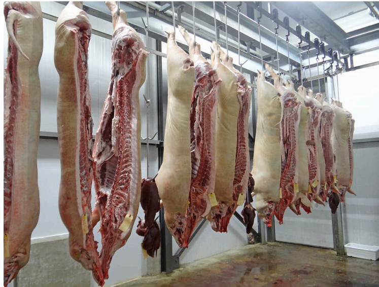
Quel tonnage pour rentabiliser le futur Pôle Viandes de la Ténarèze ?

Une question à laquelle doivent répondre rapidement tous ceux qui veulent que le projet de la communauté de communes de la Ténarèze aboutisse vite.