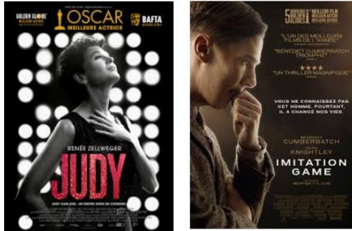
Que regarder à la télévision mardi soir?

Deux biopics, un film d'animation et, une fois n'est pas coutume, un documentaire à vous suggérer pour votre soirée de mardi.