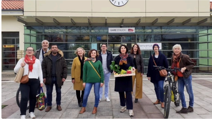
Les idées fourmillent autour de l'ancien buffet de la gare d'Auch

L'association Le Temps des citoyens veut fédérer autour d'un projet de co-construction collective. Une consultation est ouverte à tous sur sa page Facebook.