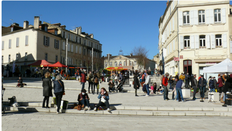
La surprise du piéton