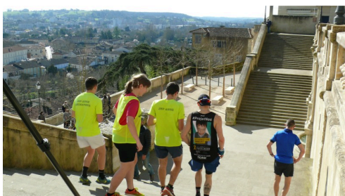
C'est reparti pour une descente.