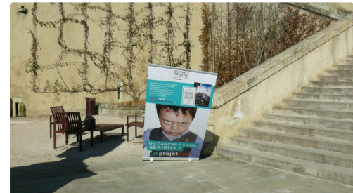
Affiche du #projetNoé.