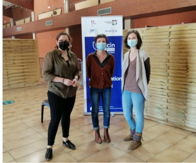
La vaccination se poursuit dans le centre de renfort de Vic-Fezensac

Samedi 27 février, 120 personnes ont reçu la 2ème injection de vaccin anti-covid au centre de renfort de Vic-Fezensac situé dans la salle polyvalente aménagée à cet effet.