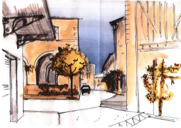
Rénovation et embellissement du centre-bourg

La conjonction de plusieurs projets élaborés depuis quelques années, a permis de définir le programme de réaménagement du centre de la bastide.