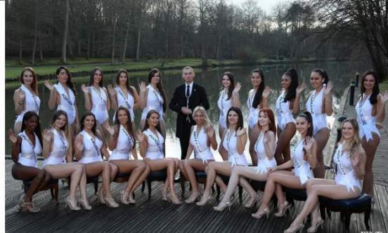
L'élection de Miss Elegance France aura bien lieu