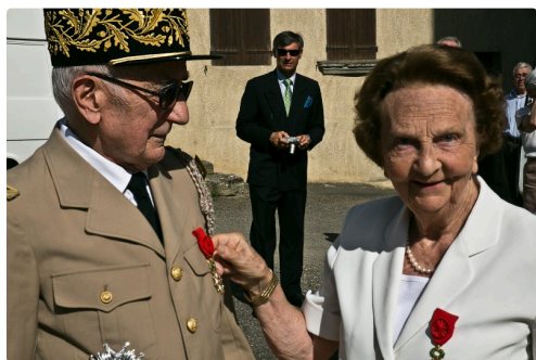
Avec Geneviève de Galard qui lui remet les insignes de Grand Officier de la Légion d'Honneur