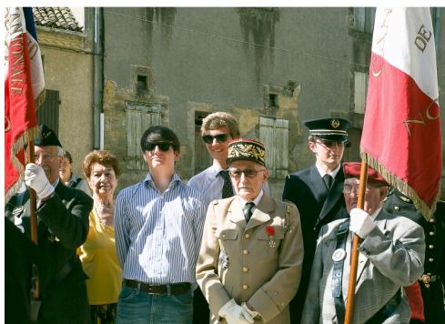
Avec la famille, il vient d'être fait Grand Officier (le 10.08.2012)