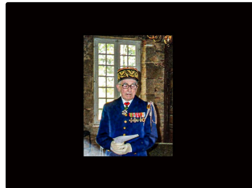
Lors d'une remise de décoration - Photo communiquée par Bertrand de Pesquidoux