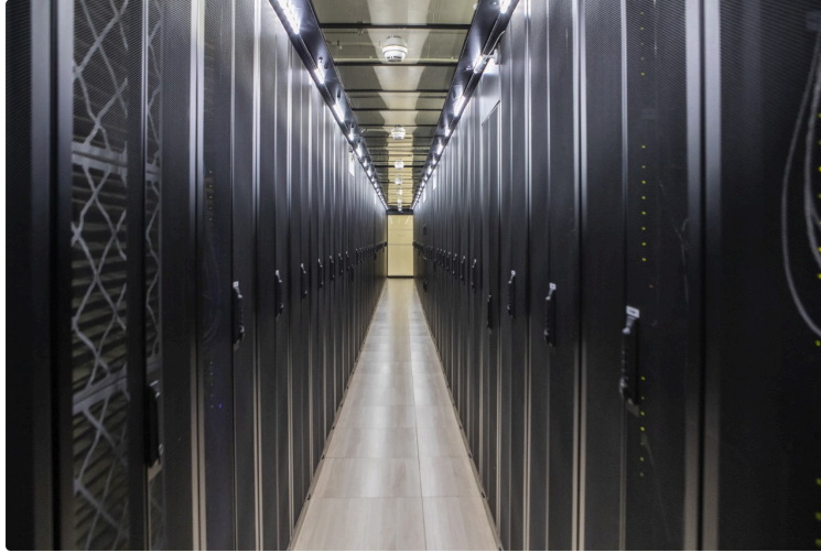
Le Gers aura son Data Center

C'est un projet de longue date qui est en train de prendre forme désormais dans le Gers. Avec l'arrivée de la 5G dans le département, l'occasion d'installer un data center était trop belle pour la laisser filer. En travaillant de concert, Gers Numérique, FullSave et Apexi vont permettre au département de se désenclaver numériquement, et donc économiquement.