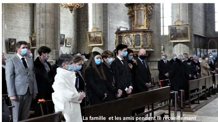
La famille et les amis pendant le recueillement