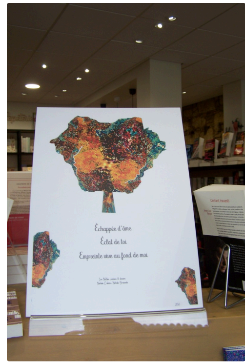
Collage de Nathalie Straseele et Haïku de Nathalie Crabère.