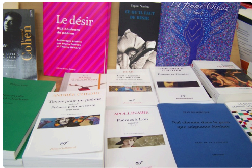
Un choix de livres sur le sujet en passant par les Haïkus de Bashô, Léonard Cohen, Recueil de poèmes sur le sujet....