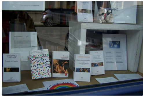
Une des vitrines animée par des livres choisis...