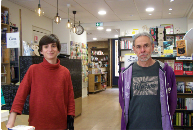
Le Désir, 23e édition du " Printemps des Poètes"