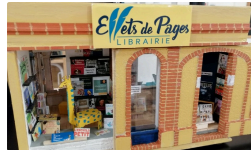
EFFETS DE PAGES.jpg