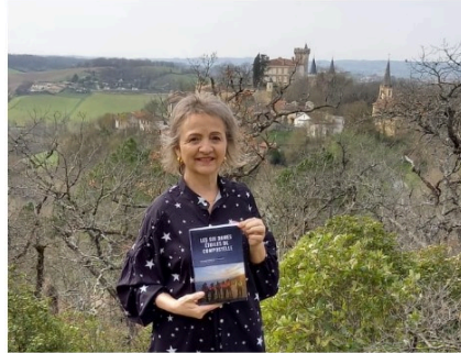
"Les six dames étoiles de Compostelle" disponible en version papier !