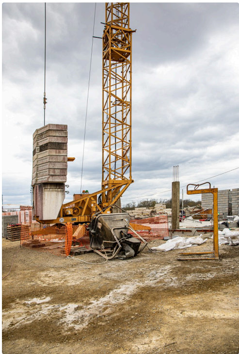
Le chantier le 18 mars