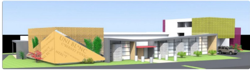
Maquette de l'architecte