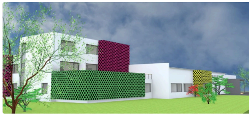
Maquette de l'architecte