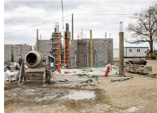
Le chantier le 18 mars