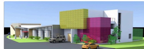
Maquette de l'architecte