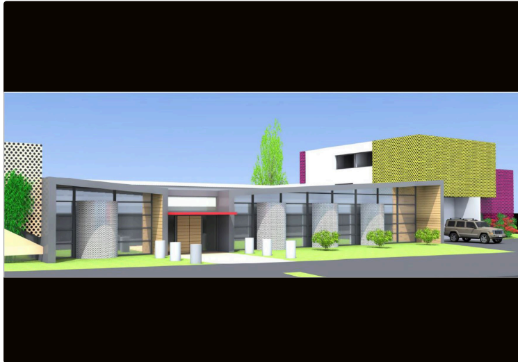
Les filières du vin et de l'armagnac vont avoir leur Maison à Éauze

Pour les services aux professionnels et l'information œnotouristique