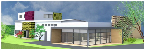
Maquette de l'architecte - communiquée par le BNIA