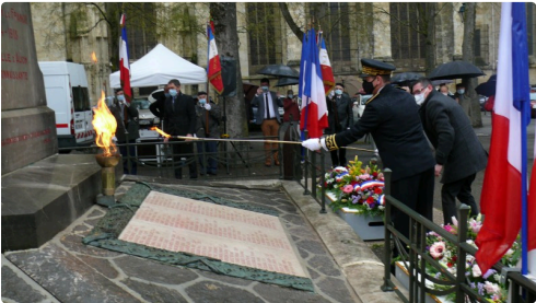
Ravivage de la flamme.