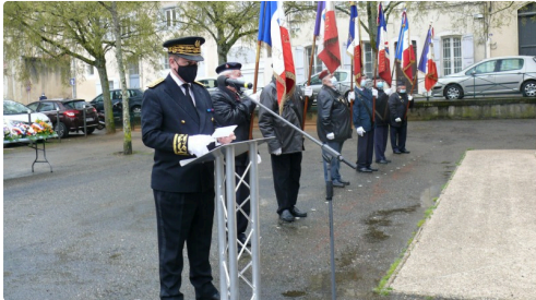
Lecture du message ministériel.