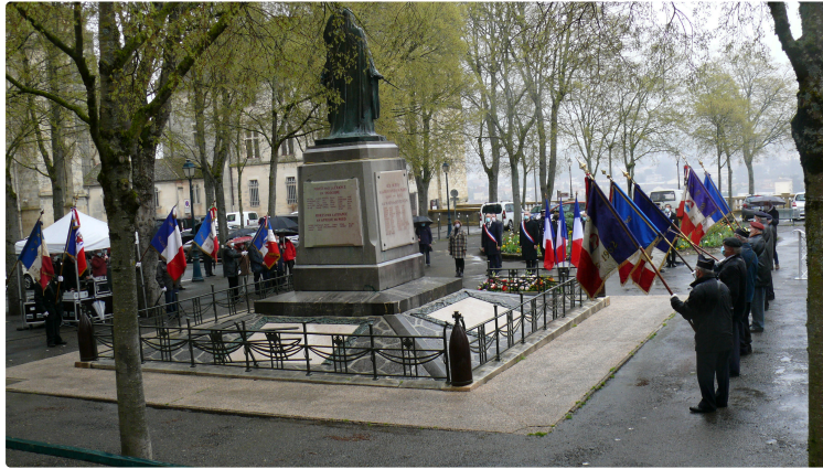
Hommage aux anciens combattants et victimes civiles d'Afrique du Nord

La commémoration a débuté à Pavie pour se poursuivre ensuite à Auch