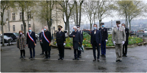
Les personnalités à Salinis.

C'est pour cela que le président de la République souhaite que nous portions un regard de vérité sur notre histoire commune avec une volonté de rapprochement et de respect de chaque mémoire. A l'instar de cette journée nationale, la France reconnaît toutes les mémoires, n'en occulte aucune et travaille à construire une mémoire apaisée ».