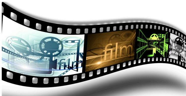
Fête du court métrage 2021 : soirée en ligne vendredi 26 mars

Le Festival du Court Métrage d'Auch continue de faire vivre le court métrage et s'associe avec L'atelier de Pechbonnieu pour organiser une séance de courts-métrages en ligne ce vendredi 26 mars 2021 à 21h.