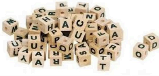
Solution des jeux du week-end

Alors, combien de carrés avez-vous comptés ?