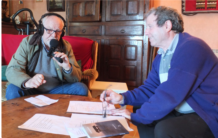
Un circuit poétique à découvrir à travers tout le village

Ecoutez aussi le printemps des poètes valenciens sur DFM 930 !