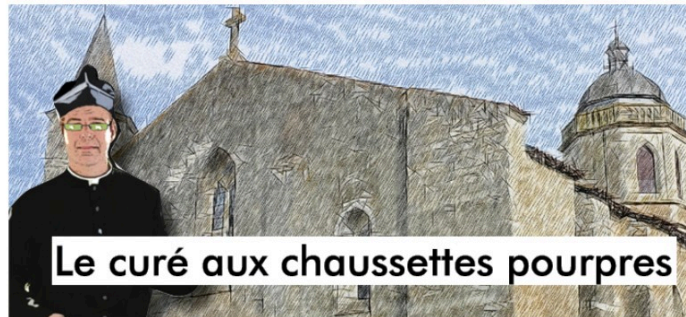
Le petit monde de Vic : Le curé aux chaussettes pourpres