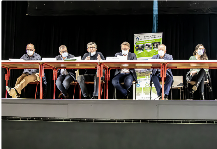
L'accroissement continu des déchets menace notre quotidien (Nogaro)

On le voit avec l'exemple du Sictom Ouest