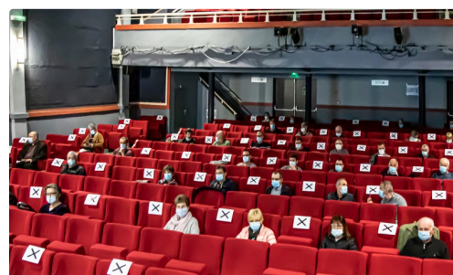
Vue de la salle de cinéma lors de l'assemblée générale