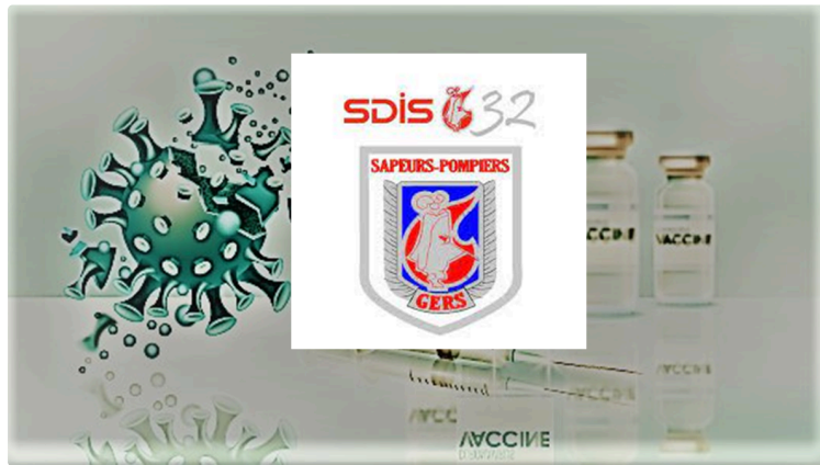
veillée d'armes chez les pompiers gersois

Après l'allocution du président de la République les pompiers gersois sont prêts.