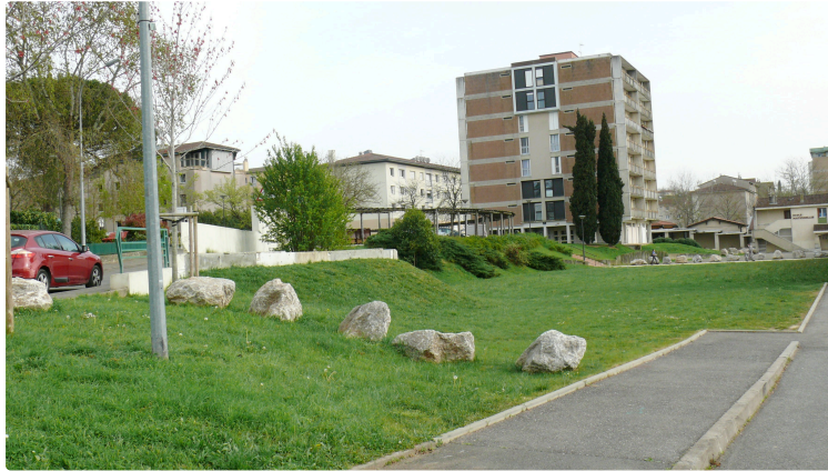
Le piéton du Garros apprécie le renouveau de son quartier

Plus habitué à faire la une pour ses faits divers, délictueux ou incendiaires, le quartier du Garros, jadis attrayant, prospère et convivial, se refait progressivement une beauté, avec la suppression de verrues, le ravalement des façades par les entreprises spécialisées, la restructuration des espaces verts et des abords des bâtiments par les services municipaux et l'équipe de la régie de quartier « Garros Service ».