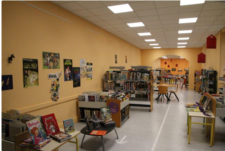
Une bonne nouvelle pour les familiers de la Médiathèque

Avec, en prime, quelques conseils de lecture