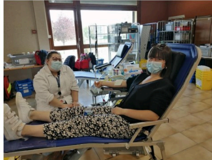
Une première collecte de sang réussie pour la nouvelle Amicale du Don du Sang vicoise

Mardi 6 avril et le mercredi 7 avril s'est déroulée la 1ère collecte de sang en ce début d'année 2021 organisée par l'EFS Toulouse et l'Amicale Don de Sang tout nouvellement reconstituée à Vic Fezensac.