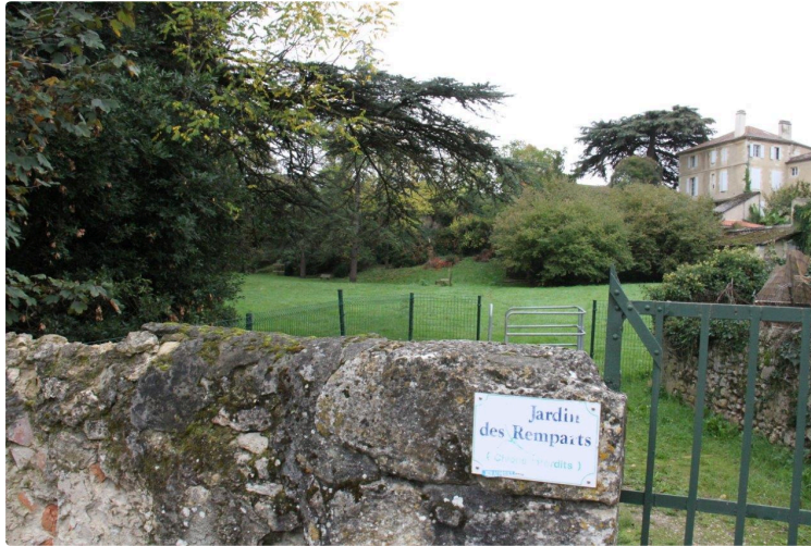
La biodiversité va prendre racine au Jardin des Remparts

En ce lundi soir, 12 avril, dans la salle du Conseil municipal, une convention vient d'être signée entre la mairie et deux associations condomoises : Convergence écologique Condom-Ténarèze (CECT) et Tissage , mais aussi avec la participation du Conseil Municipal des Jeunes.